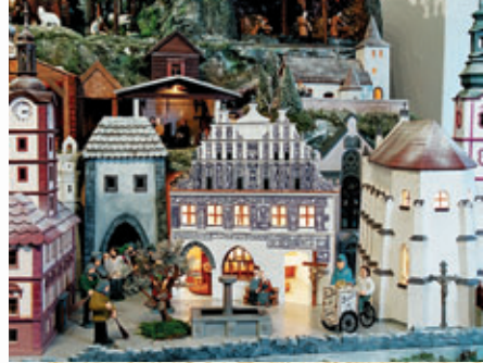
Radnice, bývalé městské brány, Rozacínovský dům, kostel sv. Václava • Town-Hall, former Town Gates, Rozacínovský House, St. Venceslaus' Church • Rathaus, ehemalige Stadttore, Rozacínovský-Haus, St. Wenzels-Kirche