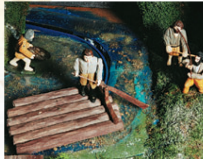
Plavení dřeva • Timber rafting • Holzschwemme

Die Konstruktion ist aus Kiefer hergestellt, Häuser und Figuren aus Lindenholz geschnitzt und die Landschaft mit Hilfe von Polystyren und Modellmaterial fertig gemacht. Es wurden etwa 30 m 2 Pressschichtholz, 1,5 m 3 Kieferholz und mehr als 6,2 m 3 Lindenholz benutzt.