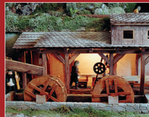
Katr a annínská sklárna (vpravo) • Saw-mill and glassworks in Annín (right) • Hammerschmiede und Glashütte in Annín (rechts)

camels, pilgrims from the East etc. Important sights of Sušice can be seen in the third line: Town-Hall, St. Venceslaus' Church, Chapel of the Angel the Guard, Rozacínovský and Voprchovský Houses (present museum), two former Town Gates and former Jewish Synagogue. Sušice and Šumava Regions are demonstrated by the typical dominants of Svatobor View-Tower, the Castle of Kašperk, the Castle of Rabí, the glassworks in Annín, St. Mauritius' Church, St. Nicholas Church in Kašp. Hory, a farmhouse in Horská Kvilda and the former paper-mill in Prášíly. The life in the Šumava