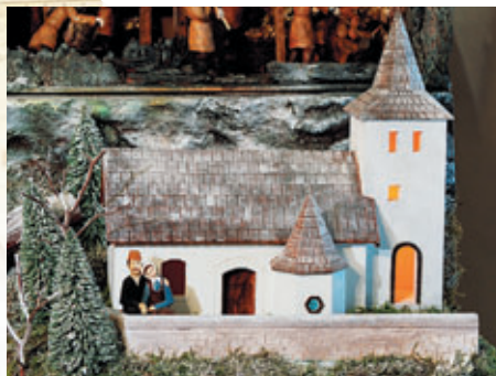
Kostel sv. Mořice • St. Mauritius' Church • St-Moritz-Kirche

Konstrukce je vytvořena z borovice, domy a figurky jsou vyřezány z lipového dřeva a krajina je dotvořena pomocí polystyrenu a modelářských materiálů. Použito bylo zhruba 30 m 2 překližky, 1,5 m 3 borového a více než 6,2 m 3 lipového dřeva.