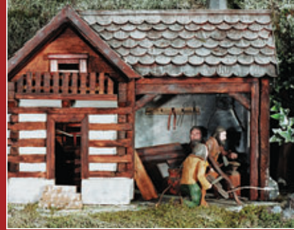
Kovářská dílna • Smithy • Schmiedewerkstatt