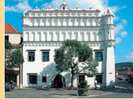
Muzeum Šumavy v Sušici • Šumava Museum in Sušice • Böhmerwaldmuseum in Sušice

einige traditionelle Handwerke dar: Holzflößen, Glas- und Streichhölzerindustrie, Hirtenschaft, Töpferei, Holzschnitzerei, Goldgewinnung und Goldwäsche, Müllergewerbe, Schneiderei... Auch Wassermühle, Papiervorbereitung und -druck, Schuhreparatur usw. sind zu sehen.