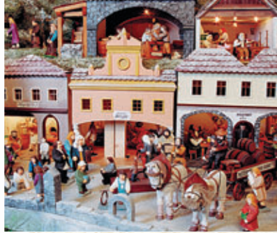
Ruch na sušickém rynku • Rush in the market-place of Sušice • Verkehr auf dem Marktplatz in Sušice